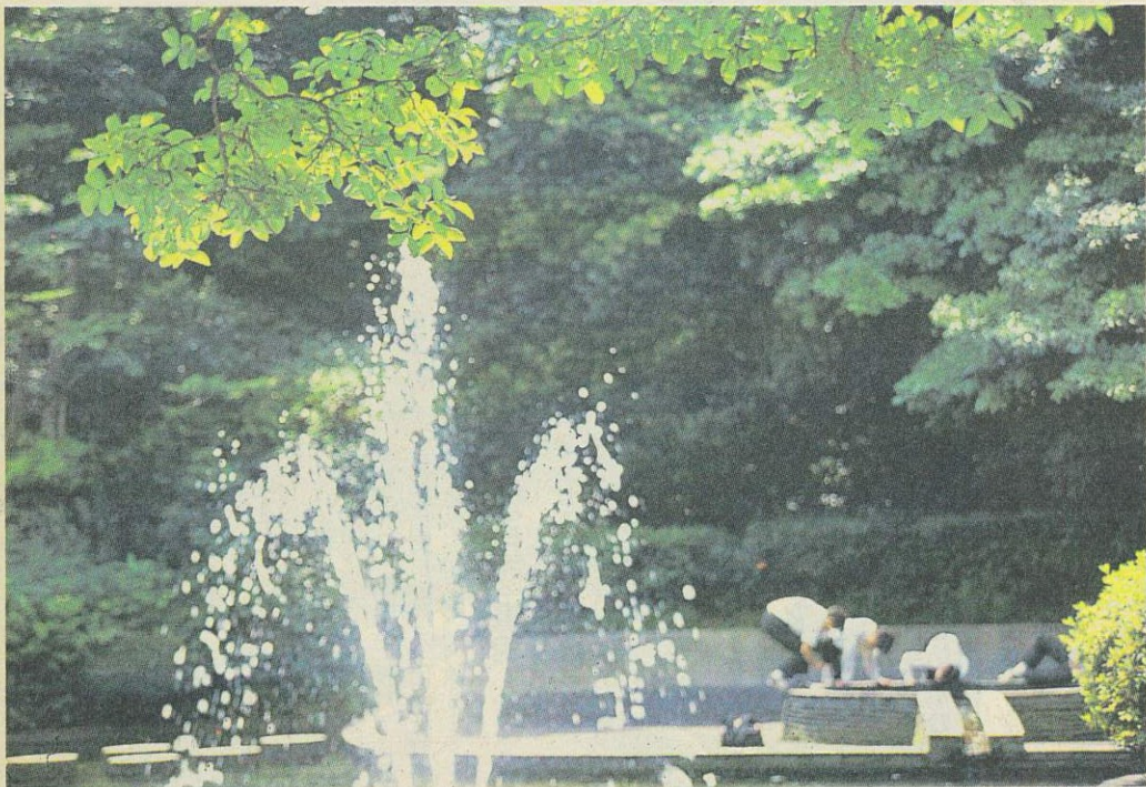
歩いて楽しい石崎川プロムナード(右)と歴史を感じさせる掃部山公園の水場(下)。涼とつるおいを与えてくれる野毛山公園の噴水(左)