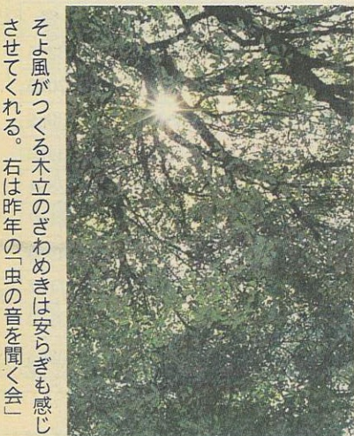
そよ風が吹く木立のざわめきは安らぎも感じさせてくれる。右は昨年の「虫の音を聞く会」