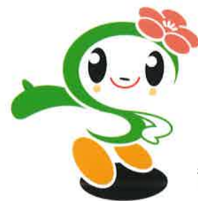
磯子区マスコットキャラクター「いそっぴ」